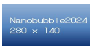
280 x 140 Bannar (Gold plan)