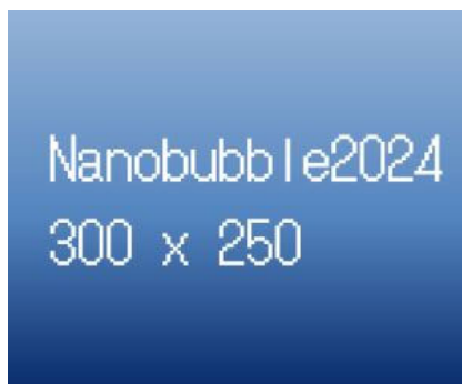
300 x 250 Bannar (Platinum plan)